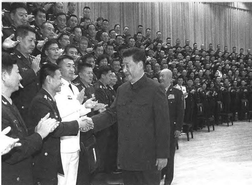
10月18日上午,中共中央总书记、国家主席、中央军委主席习近平在武汉分别接见了联勤保障部队第一次党代表大会全体代表、驻湖北部队副师职以上领导干部和团级单位主官。这是习近平亲切接见联勤保障部队第一次党代会全体代表。

(凡发现印刷质量问题,请与兰州新华印刷厂联系。地址:兰州市七里河区硷沟沿115号,邮政编码:730050,电话:0931-2607208 邮递服务热线:0931-8911729)