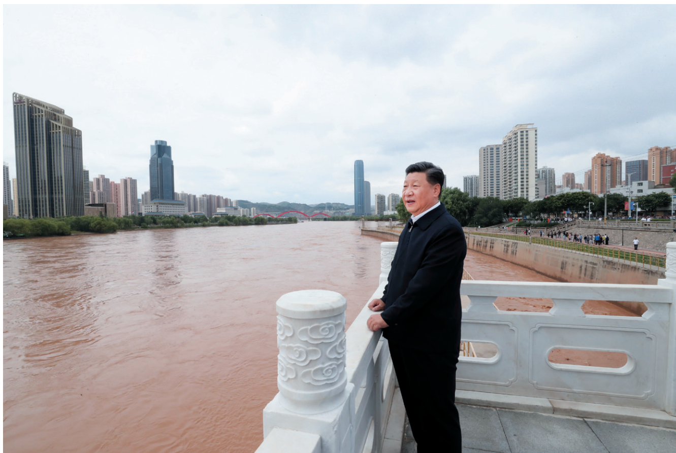
2019年8月21日下午，中共中央总书记、国家主席、中央军委主席习近平在甘肃省兰州市黄河治理兰铁泵站项目点了解黄河治理和保护、堤坝加固防洪工程建设等情况。