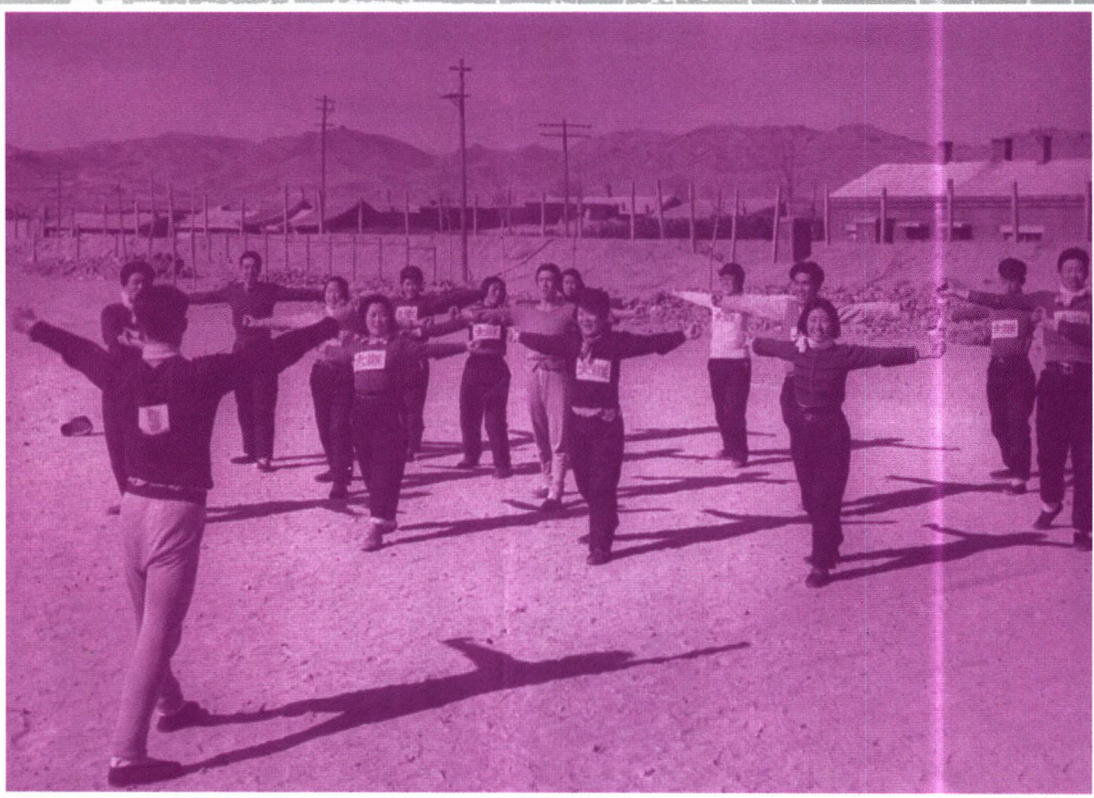
1946年4月，张家口。华北联合大学学生们在做体操。