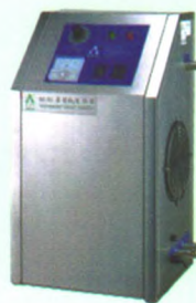
档案库房空气消毒机