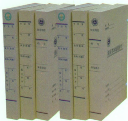
无酸纸档案盒（文书、科技）

本公司始终以“质量求生存、创新求发展、信誉引客户”的生产管理方针，以“诚信”为座右铭，赢得了广大档案界朋友的支持和厚爱。