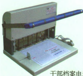
干部档案电动装订机