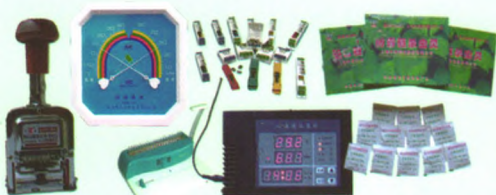
防虫药、自动号码机、温湿度控制仪