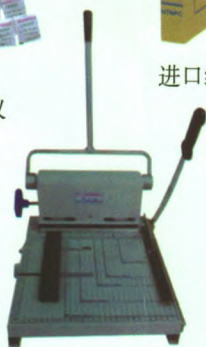
手动式干部档案装订机

公司地址：湖南省长沙市紫薇路48-1号 电话：0731-84723158 传真：0731-84785390