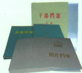
干部、光盘、照片档案