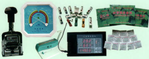
防虫药、自动号码机、温湿度控制仪