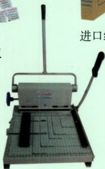
手动式干部档案装订机