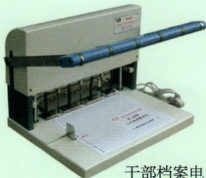
干部档案电动装订机