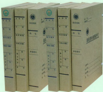
无酸纸档案盒（文书、科技）

本公司始终以“质量求生存、创新求发展、信誉引客户”的生产管理方针，以“诚信”为座右铭，赢得了广大档案界朋友的支持和厚爱。