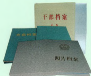
干部、光盘、照片档案