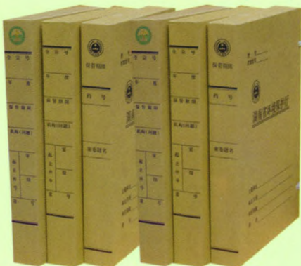
无酸纸档案盒（文书、科技）

本公司始终以“质量求生存、创新求发展、信誉引客户”的生产管理方针，以“诚信”为座右铭，赢得了广大档案界朋友的支持和厚爱。