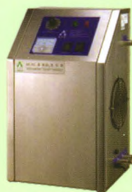
档案库房空气消毒机