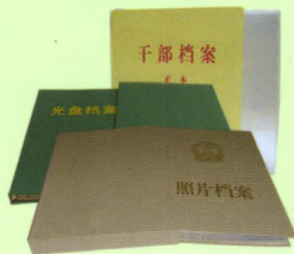
干部、光盘、照片档案