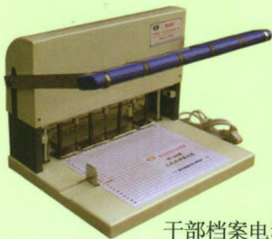
干部档案电动装订机