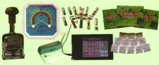
防虫药、自动号码机、温湿度控制仪