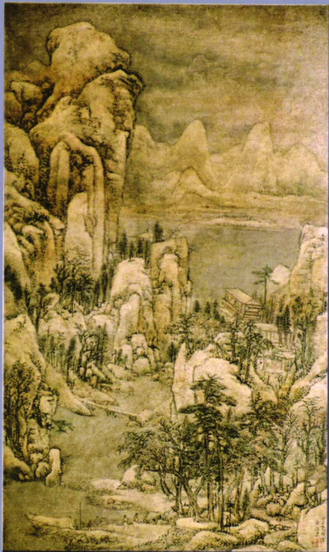
江苏省珍贵档案文献——娄东画派画作

从中国美术史上纵观中国画的发展轨迹，“娄东画派”占有重要的一席之地。作为娄东画派的发祥地，古城太仓素负“书画之乡”的盛名，其中著名的书画家有“四王”和“小四王”，留下很多不朽的艺术瑰宝，奠定了“娄东画派”在清代画坛的统治地位。“四王”中王原祁年纪最轻，但成就最高。他深得康熙赏识，因而师承者甚众，遂形成一独立的画派。因王原祁为太仓人，太仓亦称娄东，故称“娄东画派”。当时娄东画派声势浩大，几可左右艺林而为后人宗仰。以王原祁为首的“娄东画派”，在画坛上产生了深远的影响，成为清代的正统画派。王氏后裔师承有绪，画学精进，涌现出了名震一时的“小四王”。王宸与王昱、王玖、王愨并称“小四王”，实乃“娄东画派”的重要骨干力量。此后四王画风代代传承，娄东画源后继绵延。太仓市档案局馆藏的娄东画派画作，充分具备娄东画派精到的画风特点，有极高的观赏和收藏价值。