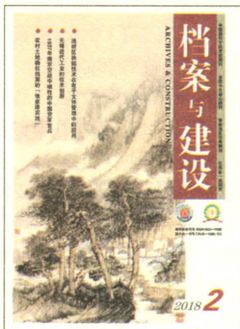
封面 宋文治《松隐觅句图》 太仓市档案馆藏