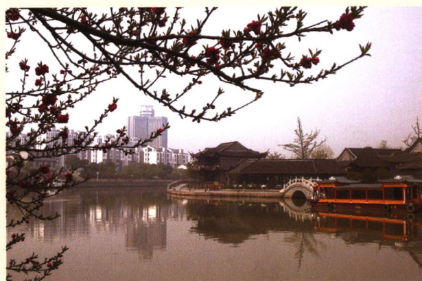
古运河风光(周泽华)