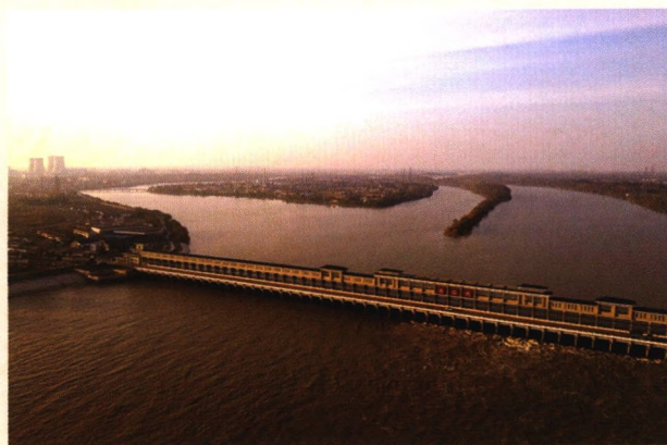
俯瞰扬州万福闸(孙敏)