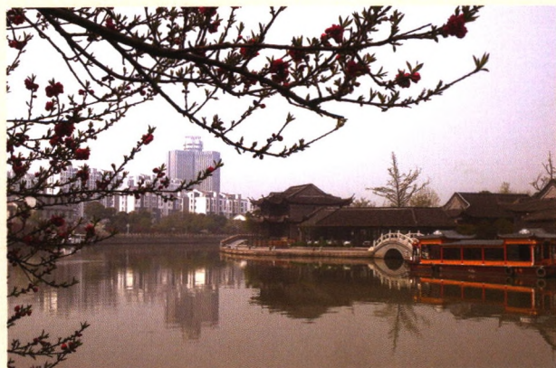
古运河风光(周泽华)