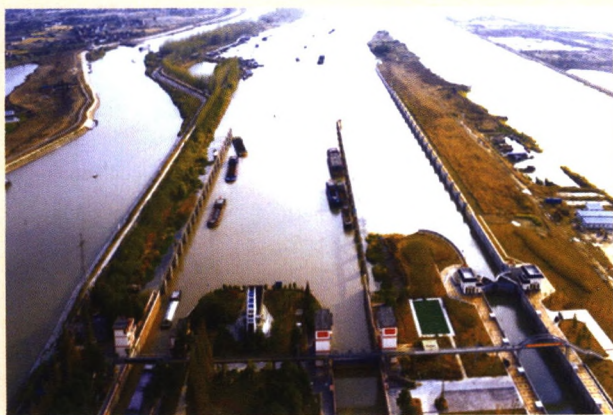
扬州邵伯三线船闸(赵辉)