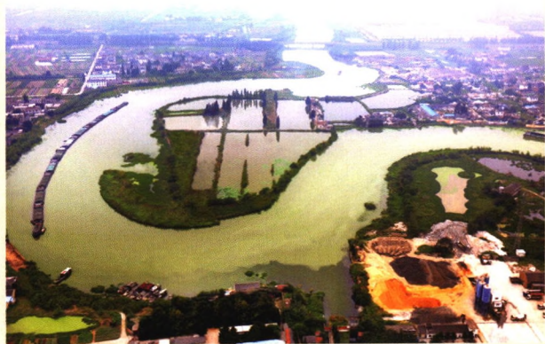
古运河三湾段(程建平)