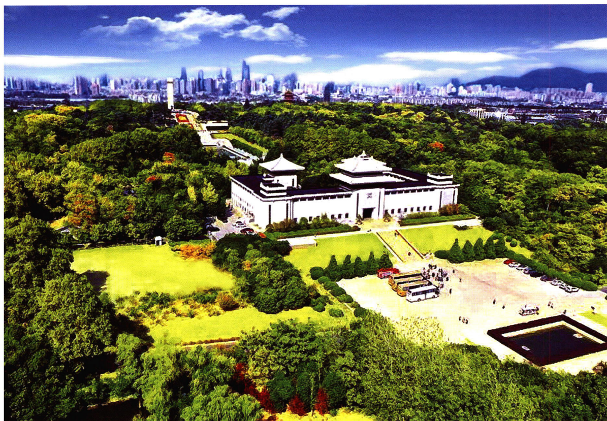
南京雨花台烈士陵园

国际标准刊号 ISSN1003—7098 国内统一刊号 CN32—1085/G2