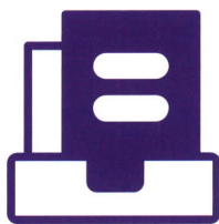
电子档案存证保全系统