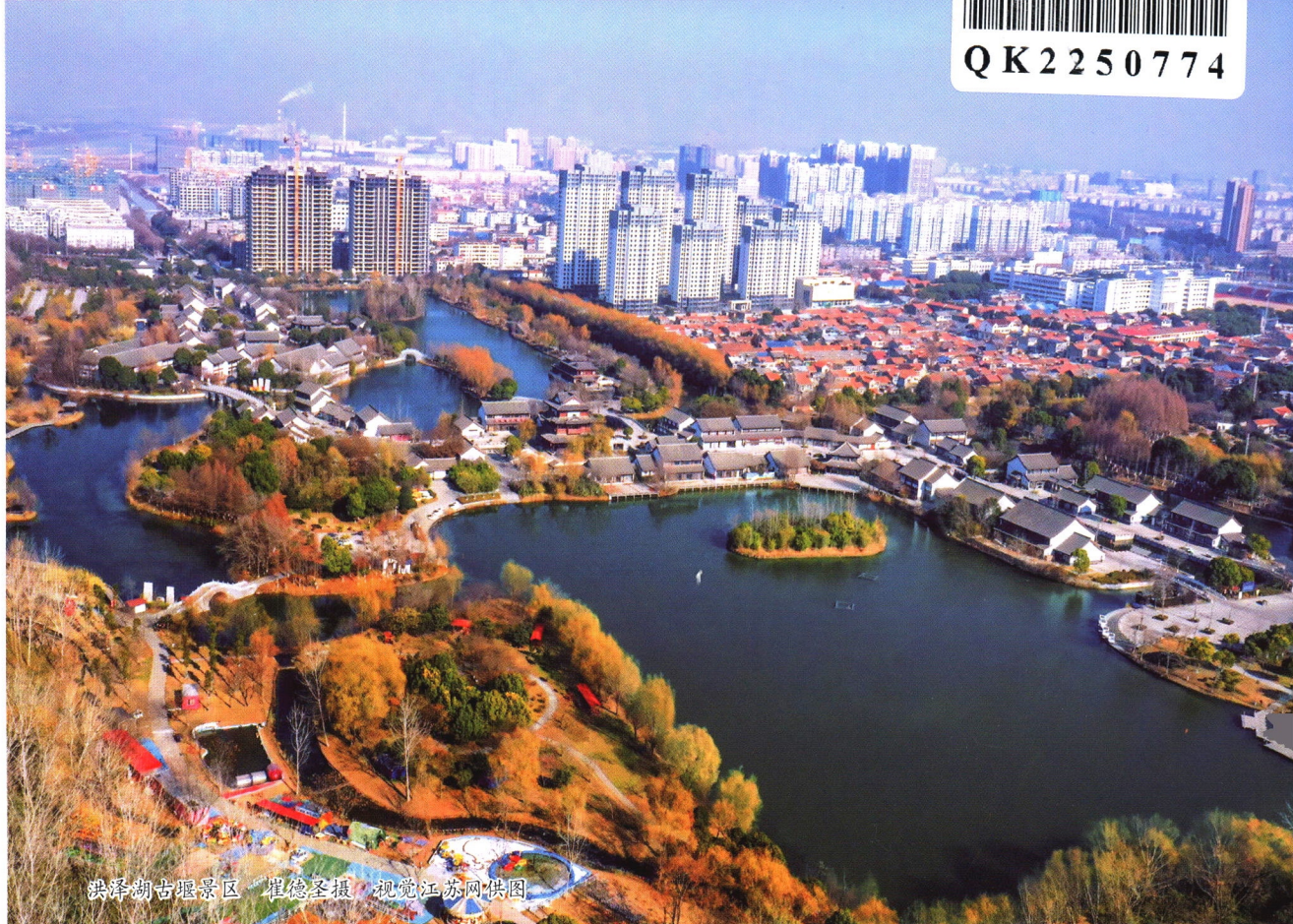
洪泽湖古堰景区