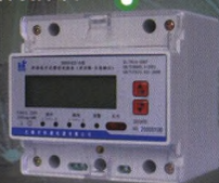
DDSY422-D 单相电子式费控电能表 (双回路-负荷辨识)