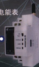
DDS122-D 单相电子式电能表 +导轨式无线采集终端