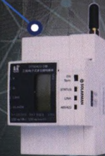
DTSD422-D 三相电子式多功能电能表+导轨式无线采集终端