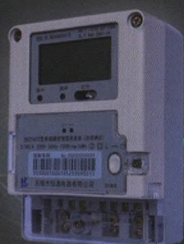
DDZY422 单相费控智能电能表 (负荷辨识)