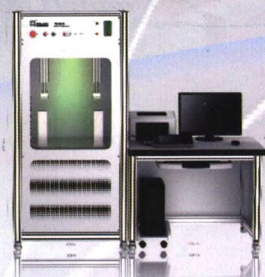
TK1000 直流传感器检测装置