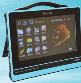
电能质量分析仪（平板式）