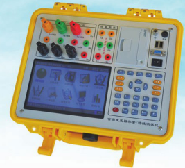
有源变压器容量—特性测试仪