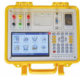
电流互感器现场校验仪