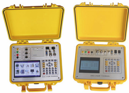
无线二次压降及负荷测试仪