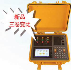
变压器变比测试仪