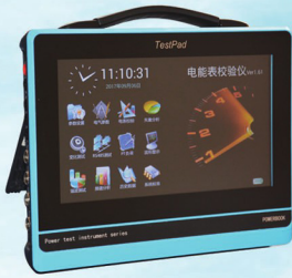
三相电能表现场校验仪（平板式）