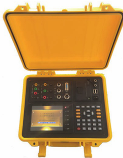
电能电质综合测试仪