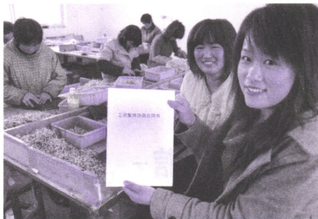
集体协商上升法律层级