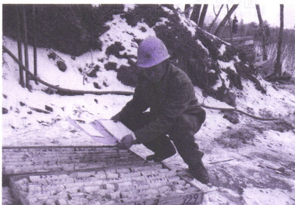
钻探,一孔之见定宝藏