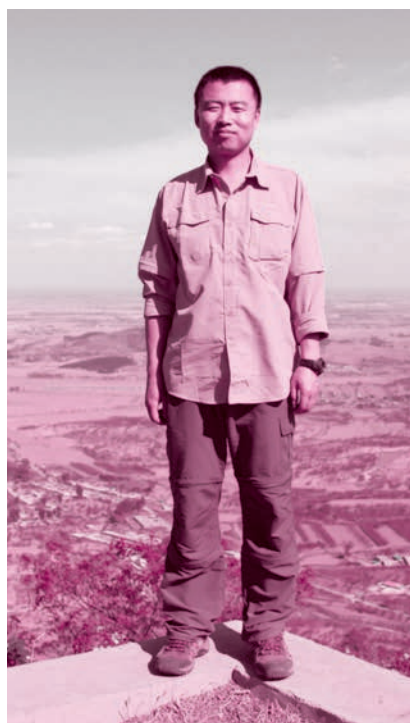
我要像流星那样去温暖人心