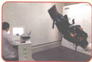
国内外先进的晕眩诊疗系统