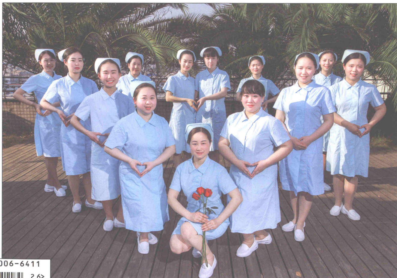
封面照: 四川省德阳市人民医院护士