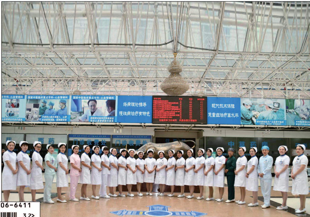
■ 河北以岭医院护士合影