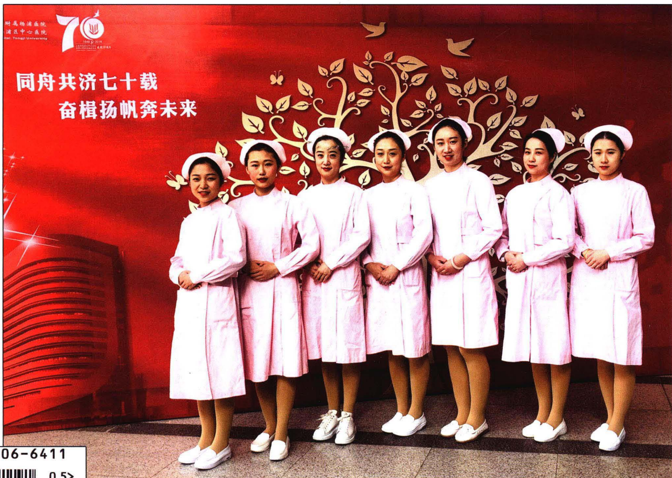
封面照: 同济大学附属杨浦医院护士