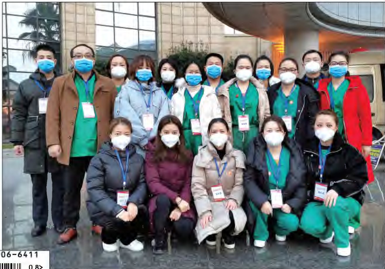
封面照：湖南省衡阳市首批援鄂医疗队部分队员