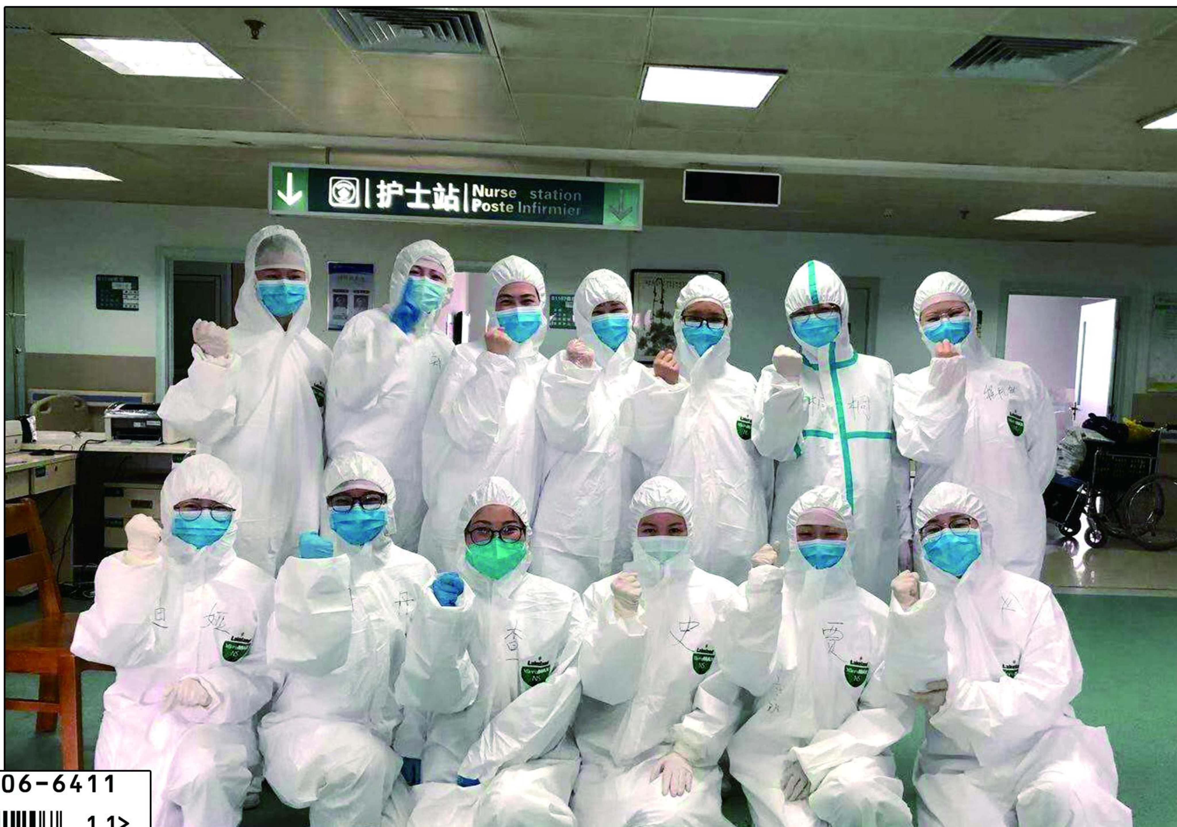
封面照: 武汉大学中南医院肾内科抗疫前线合照