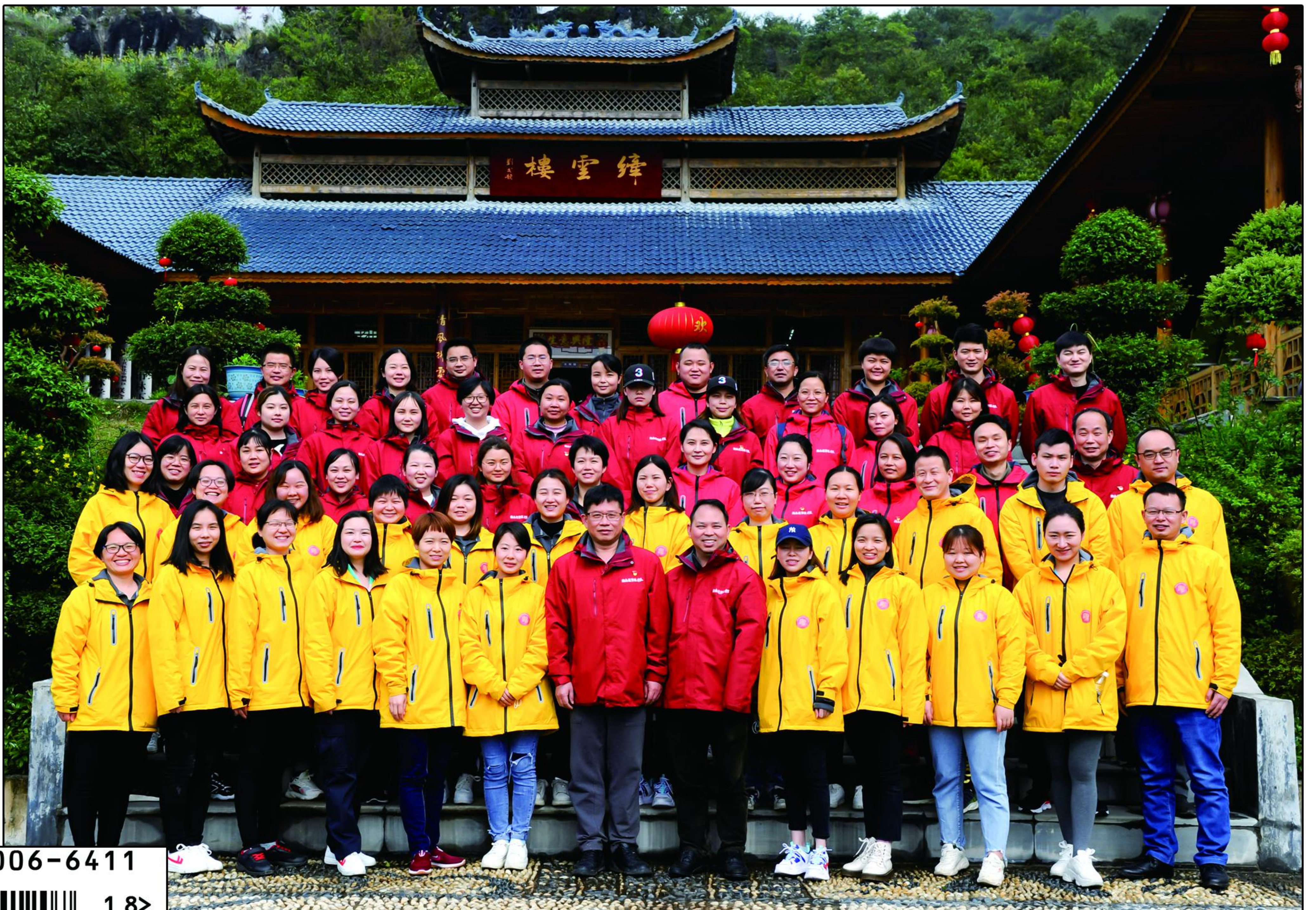
封面照：久违的笑脸（湖南省怀化市援鄂医疗队凯旋归来）