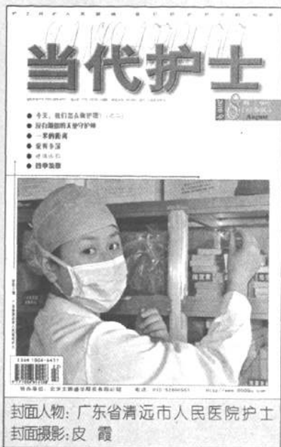
封面人物: 广东省清远市人民医院护士