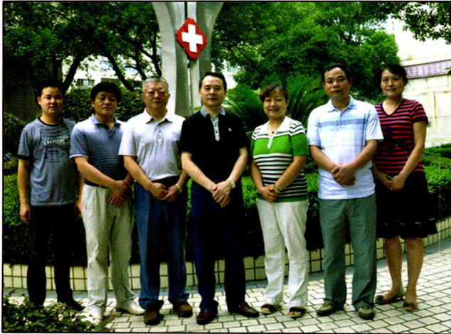
澧县人民医院领导班子合影