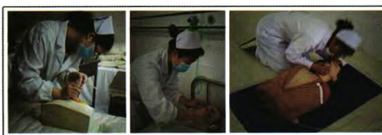
基础护理技能操作