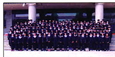
学士学位授予合影