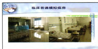
临床普通模拟病房