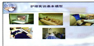
护理实训基本模型