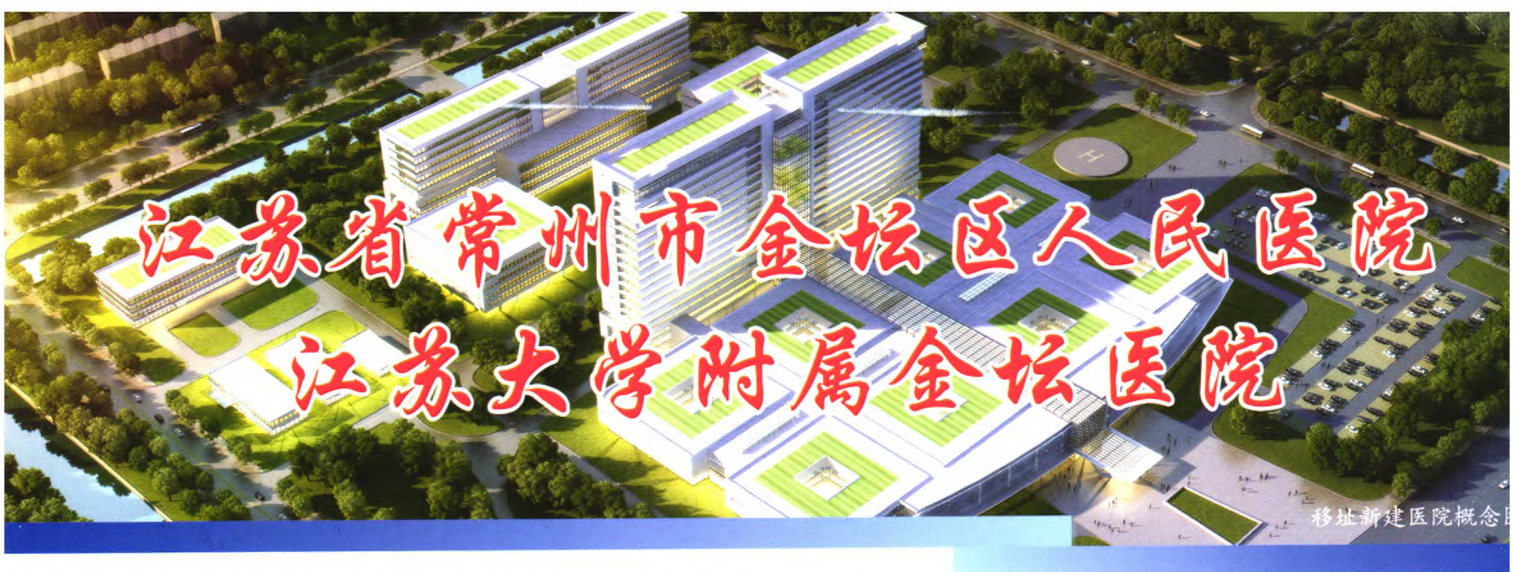
移址新建医院概念图

金坛人民医院地处江苏省南部,为宁、沪、杭三角带之中枢,素有“鱼米之乡”“江东福地”之美誉。该院始建于1919年,历经九十多年的变革和发展,现已成长为一所集医疗、教学、科研、预防、保健为一体的综合性二级甲等医院,今年还积极申报了三级医院创建工作。是江苏大学附属医院,东南大学医学院、扬州大学医学院和南通大学医学院的教学医院,是盐城卫生职业技术学院临床学院,是江苏省住院医师、全科医师规范化培训基地。