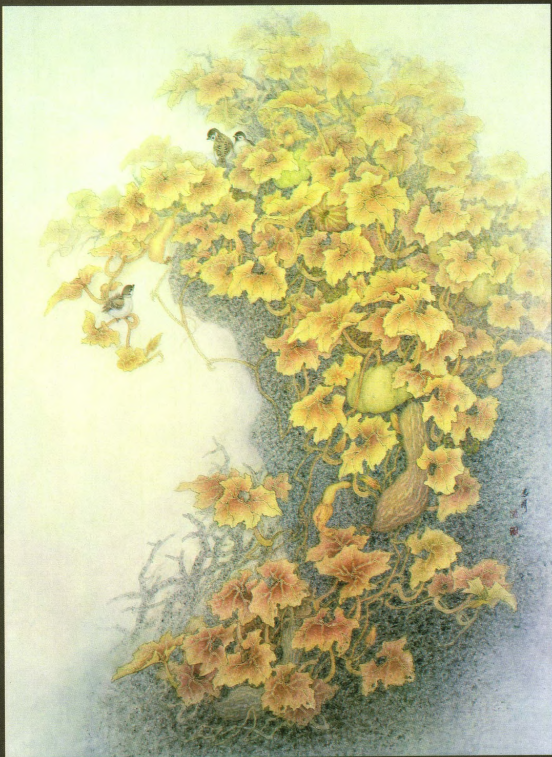
扶石栖雀也相宜（工笔画） 魏惠娟 作