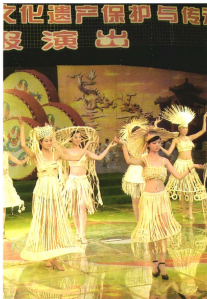
大名草编 华美转身

大名县的草编工艺据说已有1500年的历史，清朝雍正年间传入西付集乡朱家村，后传至大名县卫河以东地区，招辫手工艺遂至千家万户。