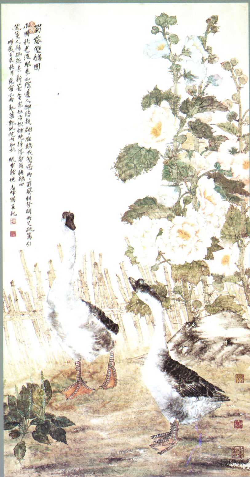
蜀葵双鹅图（国画） 陈志峰 作