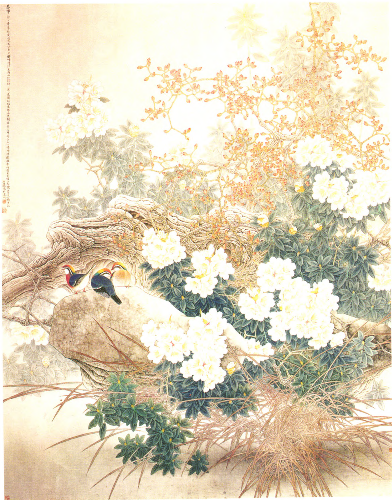
春晖（工笔画）/田云鹏