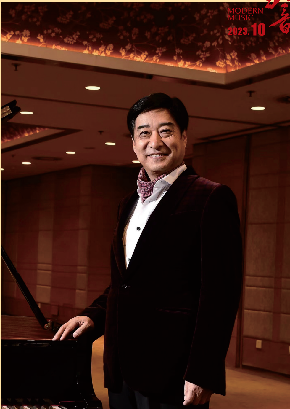
中国教育学会音乐教育分会前理事长、人民音乐出版社前社长 吴 斌