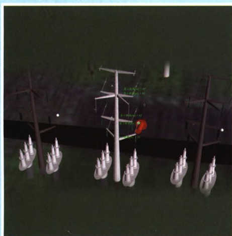
220千伏户外GIS变电站 110千伏垂直出线三维设计图