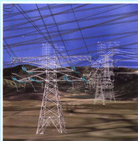
输电线路三维设计图

地址：中国杭州下城区华电弄1号一号楼 电话：(+86) 571-51216866