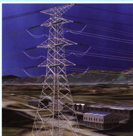
输电线路三维设计图