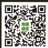
《地理研究》微信公众号