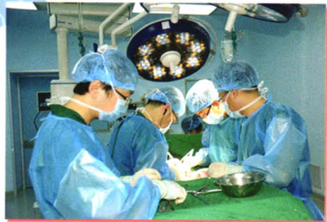
总医院骨科开展腰椎间盘突出可扩张性微创手术。