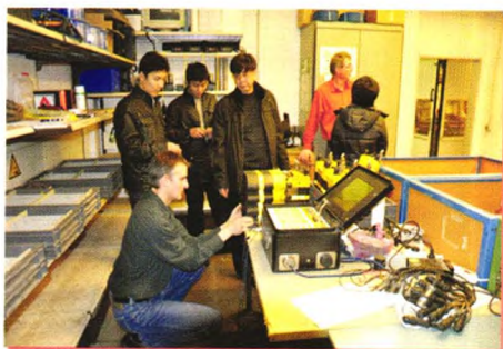
河北煤科院率先从德国引进世界先进的槽波地震探测仪，组织技术人员赴德国进行培训，解决了超大型工作面内部及工作面外围地质构造探测的技术难题。