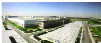
中国烟草白沙集团