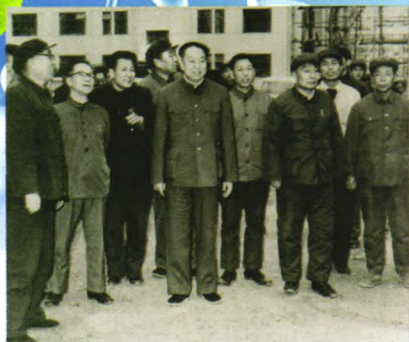
1981年4月，时任中共中央主席、中共中央军委主席华国锋同志视察我公司唐山建设住宅小区工程。