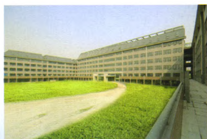
邯郸职业技术学院实验综合楼

邯郸市邯二建筑工程有限公司，前身为中央人民政府纺织工业部基本建设局工程公司，1953年组建于北京，1956年奉命进入邯郸承建联合纺织厂，后划归地方，更名为邯郸市第二建筑工程公司。2002年企业改制为投资主体多元化的有限责任公司。公司资质为房屋建筑工程施工总承包一级、市政公用工程施工总承包一级、建筑装修装饰工程专业承包一级等多项施工资质。公司现有职称的工程技术人员和经济管理人员568人，具有高级职称的47人，中级职称128人，工程技术人员335人。拥有各种施工生产设备1000余台。具有年完成建安工作量20亿元和竣工面积100万平方米的生产能力。1998年至今公司连续通过了GB/T19001-2008/ISO9001:2008和GB/T50430-2007质量管理体系认证，GB/24001-2004/ISO4001:2004环境管理体系认证，GB/T28001-2001职业健康安全管理体系认证。