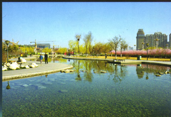
龙形绿化带