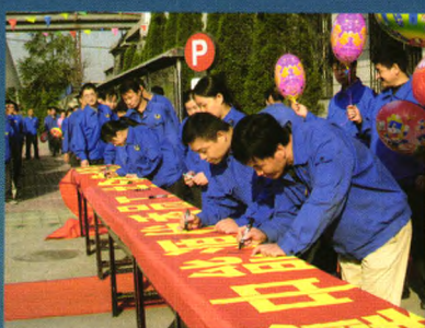
陶二电厂定期举办安全文化活动，增强职工的安全意识