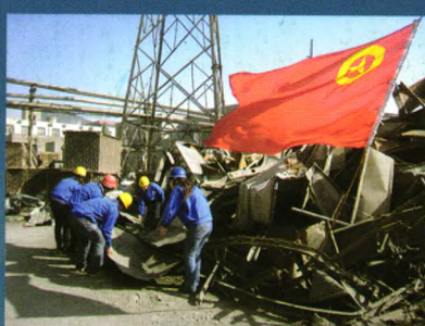
陶二电厂经常开展党团员义务奉献活动