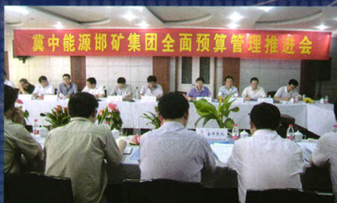
邯矿集团全面预算管理推进会在陶二电厂召开，并做经验介绍

陶二研石热电厂（以下简称陶二电厂）位于河北省邯郸市西 15 公里处，是冀中能源邯矿集团非煤产业重点厂点之一。该厂占地面积 45000 平方米，总装机容量 51MW，年设计发电量 3.06 亿千瓦时，主要产品是发电兼供热。该厂始建于 1996 年 8 月，1999 年 5 月 26 日一期工程投运。经过 2002 年、2004 年两次技改扩建，2005 年 10 月生产能力达到 51MW。现有职工 310 人，其中厂领导 6 人，大中专毕业生 97 人。在岗高级职称 3 人，中级职称 16 人，初级职称 13 人。企业管理模块为运行、检修条块式管理，“内强素质、外树形象”，积极探索出具有自身特点的发展新路子，创造了良好的经济效益。