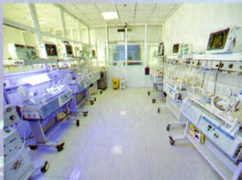
新生儿重症监护室