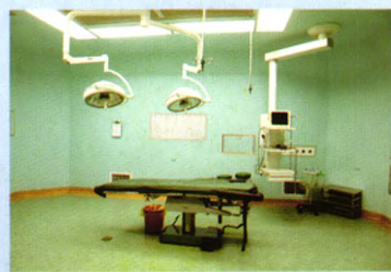
智能化层流手术间