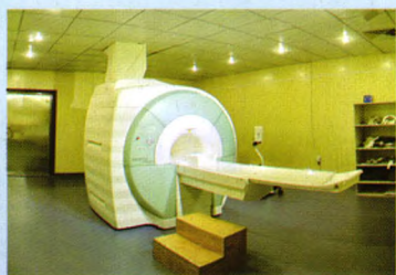
德国西门子1.5T磁共振

上善若水，医者仁心。医院始终坚持以患者为中心，以“群众得实惠、医院得发展、政府得民心”为目标，不断提高医疗水平，树立平等、和谐、融洽的医患关系，不断抒写医院发展的新篇章，开创永年医疗卫生事业发展的新纪元。