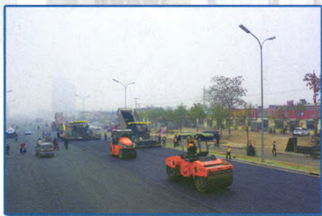
沧州市黄河路橡胶沥青面层施工