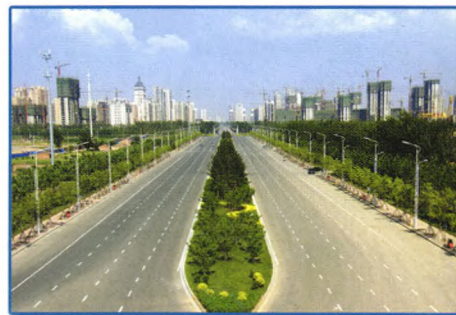
沧州市广州路道路排水工程 (2014年国家金杯示范工程)