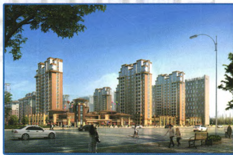
“弘仁里”项目效果图