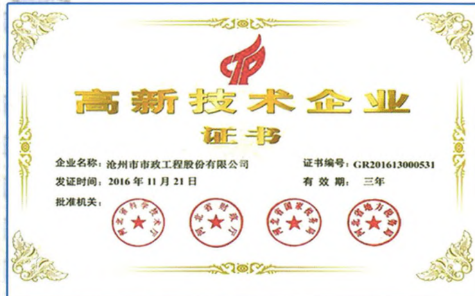
全国高新技术企业证书