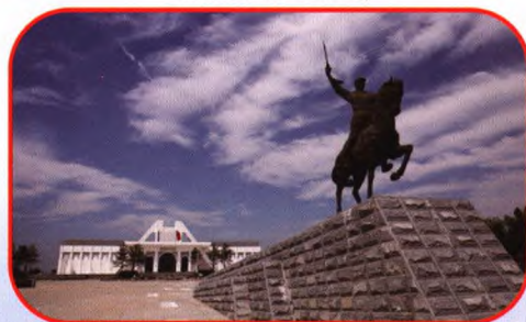
献县马本斋纪念馆