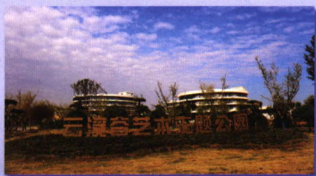
云溪谷艺术主题公园