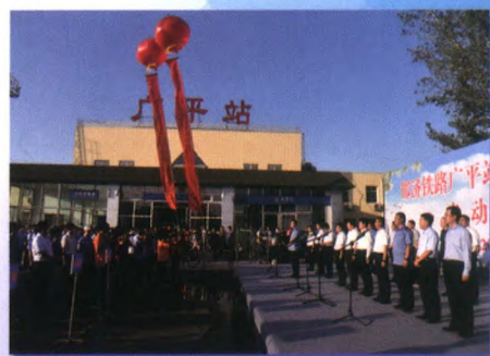
邯济铁路广平客运站开通

近年来，广平县委、县政府坚持以习近平新时代中国特色社会主义思想为指导，砥砺奋进、开拓创新，经济社会持续健康发展，人民生活日益改善，各项工作开创了新局面。发展后劲持续增强。项目支撑不断强化，累计实施亿元以上项目 100 个，争列省重点项目 13 个，规上工业企业达到 52 家。钢诺公司荣获“全国五一劳动奖状”和“省政府质量奖提名奖”，双李公司被评为“省质量效益型企业”，喜宝公司与国际第二大运动品牌“安踏”开展战略合作。城乡品质大幅提升。高标准承办第十四届中原民间艺术节，广平的美誉度、知名度、认可度进一步提升。邯济铁路广平货运站、客运站全部开通，成为邯郸东部县同时开通货运和客运火车的站点。农村人居环境整治三年行动全面完成，建成美丽乡村 34 个。整建制发展壮大村集体经济经验做法全省推广，荣获全省村集体经济发展示范县、省“四好农村路”示范县等称号。南吴村荣获国家森林乡村，西胡堡村荣获全国文明村镇，后南阳堡村、大庙村、南苏庄村被评为全省集体经济发展示范村。改革创新纵深推进。培育高新技术企业 25 家、科技型中小企业 572 家，是河北省知识产权试点县。市场主体总量达到 3.8 万户，全面深化改革工作考核连续五年全市名列前茅。荣获国家农村公路管理养护体制试点县、国家农村产业融合发展示范园创建县、省深化医药卫生体制改革工作先进县、省医养结合优质服务县等荣誉称号。群众福祉不断增进。累计投入民生资金 60.7 亿元，每年实施一批民心工程和民生实事。完成学校建设改造项目 91 个，新增校舍面积 20.5 万平方米、学位 1.4 万个。妇幼保健院、广平镇卫生院顺利迁新，中医院病房楼、残疾人康复中心等建成投用，169 个村实现标准化卫生室全覆盖。创新社会治理做法被河北省“三创四建”活动经验做法汇编编入。县镇两级退役军人服务中心（站）通过国家示范验收，经验做法全省推广。（文 / 张亚迪 刘卫华）