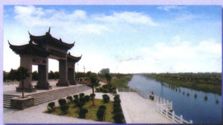
环城水系贯通全境