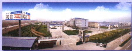
广平经济开发区一角