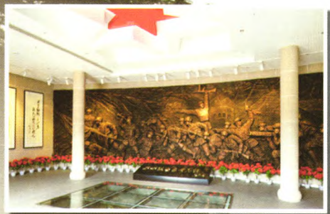
晋城烈士纪念馆大厅