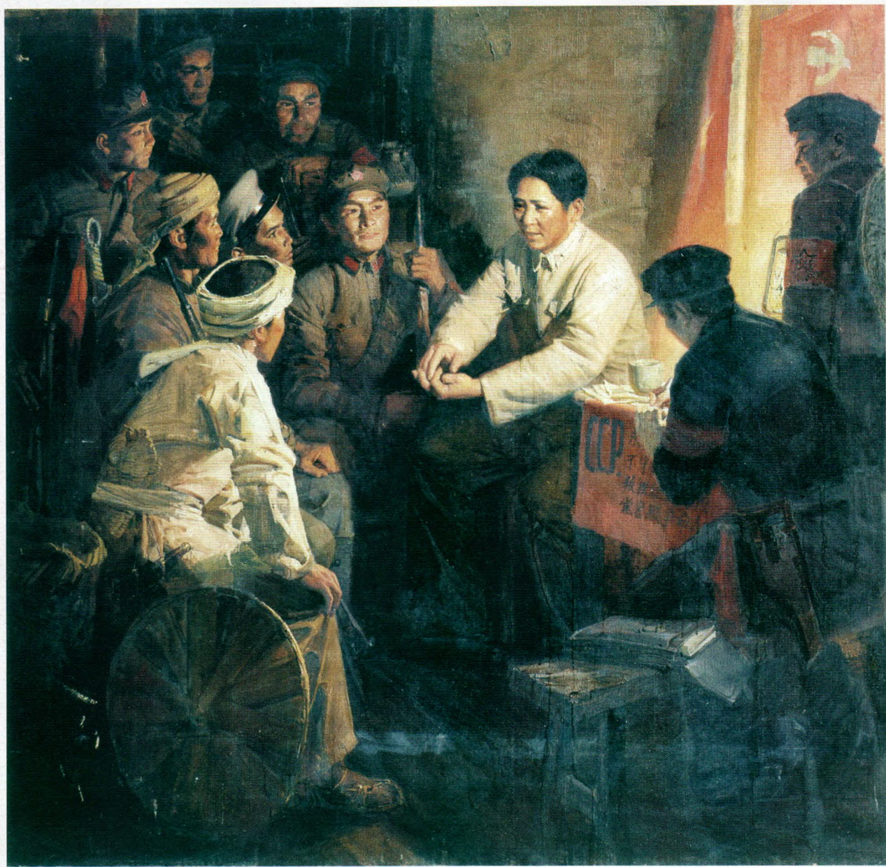
毛泽东同志在连队建党（油画） 高 泉