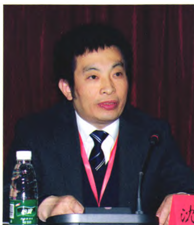
中共江西省委党史研究室主任沈谦芳讲话