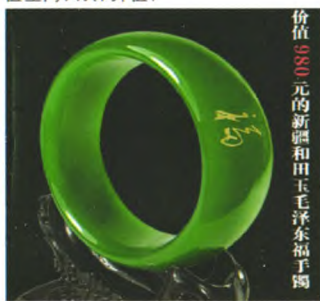
价值 980 元的新疆和田玉墨玉“毛主席福手镯”

个省份配额不到 100 套, 只收取 1380 元材料费和制作费, 普通老百姓也能买得起, 藏得起, 给广大客户预留很大升值空间, 确保升值!