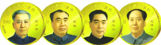
赠品: 价值 980 元“四大伟人纪念币”

纪念币属于最稳定的金饭碗, 特别是领袖纪念藏品涨幅更大, 4 席诞辰 100 周年发行的毛主席纪念币, 当年才 4800 元, 目前市价 19 万多, 0100 号在拍卖会拍出 210 万天价, 这也是当年很多有识之士总是犹豫不决的人士, 错过投资机会非常后悔的真正原因。如今念币收藏投资已成为社会各界名流投资目标, 商业领袖首选, 保值增值的 36 枚“大阅兵·开国将帅黄金大典”发行, 保值增值无风险, 转手就能卖, 实在的硬通货, 兼具“贵金属”和“开国伟人肖像名画”双重价值, 如今免费领取, 仅收象征性 1380 元, 在发行过程中很容易涨价, 因为这是抗战胜利 70 周年特批, 也可能是最后一次。