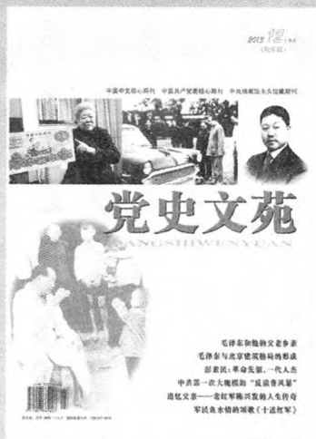
封面主图 毛泽东访问农家