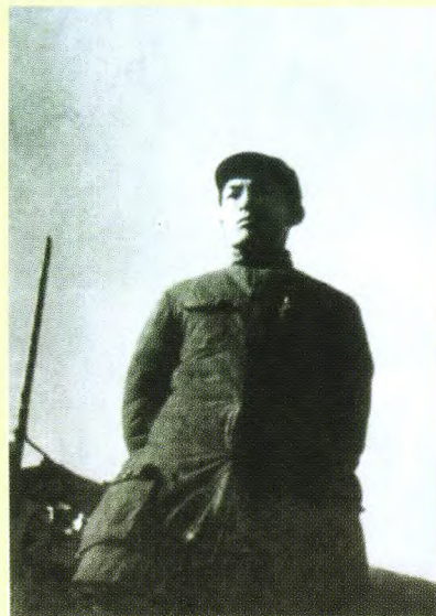
1944年冬，叶飞在苏中区党委干部会议上讲话