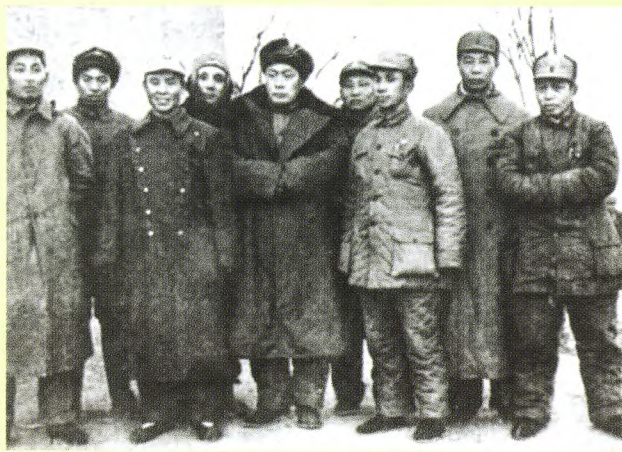
1947年1月，华东野战军领导在一起。左起：叶飞、丁秋生、韦国清、邓子恢、陈毅、唐亮、粟裕、陈士榘、谭震林