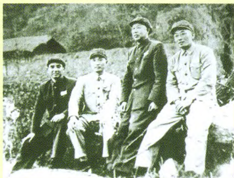
1951年10月，杨勇（左起）、张爱萍、王平、叶飞在朝鲜战地