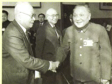
1988年，邓小平同志与叶飞在人民大会堂