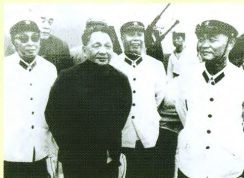
1979年8月2日，叶飞（左起）、邓小平、饶守坤、杜义德在05舰甲板上