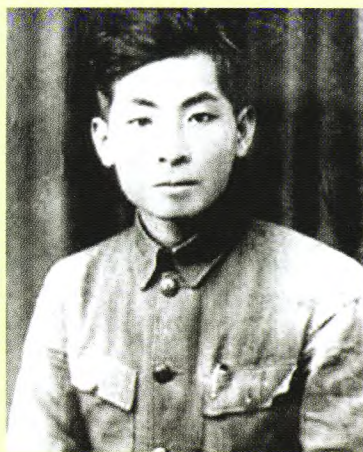
1937年，叶飞在闽东红军