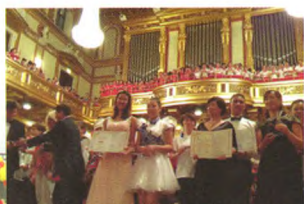
红星海学校合唱团在金色大厅参加“2013 维也纳世界和平演唱节”并荣获铜奖

学校在民族化、数字化、国际化的特色道路上不断发展，稳步前行。学校多次成功承办国家级学术研讨会及辽宁省德育工作现场会，学校阶段性成果和未来发展规划得到国内外领导专家的充分肯定。辽宁省基础教育强区评估组认为学校前瞻性办学理念和内涵发展的实践架构对于基础教育学校特色建设具有引领和示范作用。学校先后获评教育部“全国教育信息化工作试点学校”、“英特尔全球未来教育”试点学校、大连市环境友好学校、大连市教育科研基地等荣誉称号。学校舞蹈队应文化部之邀参加了在美国、澳大利亚和奥地利举办的中国文化年演出和世界和平演唱节活动，荣获金奖和铜奖，维也纳联合国总部对学校在国际平台倡导宇宙