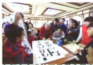
名师大家进校园是学生最喜欢的课程之一