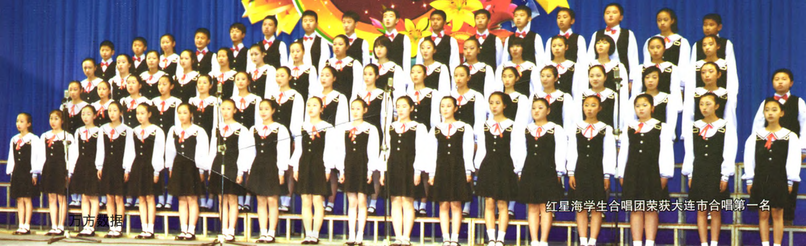
红星海学生合唱团荣获大连市合唱第一名