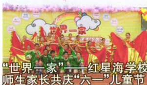
“世界一家”——红星海学校师生家长共庆“六一”儿童节