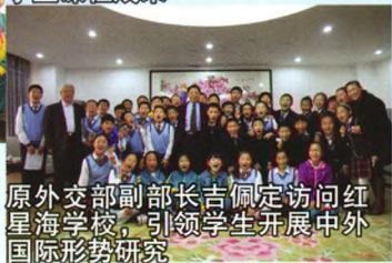
原外交部副部长吉佩定访问红星海学校，引领学生开展中外国际形势研究

系即“本根教育、和谐教育、时空生命教育”的构建，培养学生根的素养，和的素养，时空的素养，凸显“民族化、现代化、国际化”的办学特色，培养健康的、有趣味的、有根的、多元的、卓越的优秀公民。