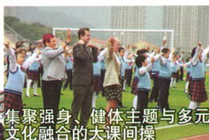
集聚强身、健体主题与多元文化融合的大课间操

学校以国家课程为核心，以地方、校本课程为两翼，以国际三大主流课程为拓展，构建了多维整合的学校课程体系，以满足学生个性化、多元化的发展需求。学校深挖课程内涵，通过三位一体的素质教育体