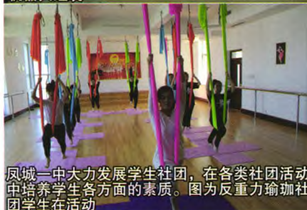
凤城一中大力发展学生社团，在各类社团活动中培养学生各方面的素质。图为反重力瑜伽社团学生在活动

华北大学生共计40余人，学校各批次上线率位居丹东地区前茅，升学率连年稳步上升。特别是2006年以来，高考成绩更是连创新高。2006年以来丹东地区共考入清华北大100人，其中凤城一中占53人，2007年以来丹东地区共产生文理状元19人，其中凤城一中占10人。