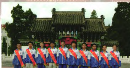
凤城一中一贯保持优异的教学成绩，在历年高考中均取得佳绩。图为2009年，考入清华北大的学生在棂星门前合影