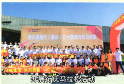
开展行庆马拉松活动

与消费信贷产品和农贷产品组成的哈行小额信贷品牌，服务优质高效、业务小快灵活的特点得到了社会各界的广泛认可。截至2017年6月，该行累计投放小额贷款近300亿元，信贷投放量连续多年位居沈阳市同类银行前列。先后荣获了“最佳中小企业服务银行”“辽宁省支持小微企业发展先进单位”“驻沈银行中小企业融资工作先进单位”“服务小微企业优秀单位”等荣誉称号50余项。