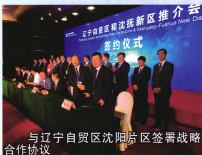
与辽宁自贸区沈阳片区签署战略合作协议

精准定位，聚焦小微，逆势中稳健发展。 该行以服务地区经济发展为己任，在辽沈地区着力打造了由小企业信贷产品、个人经营