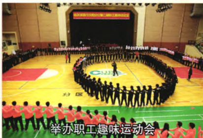
举办职工趣味运动会