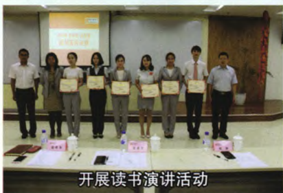
开展读书演讲活动