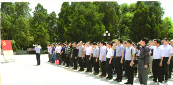
安徽省工商局扎实开展“两学一做”学习教育——向党旗宣誓

党的十八大以来,该局全面纵深推进从严治党,认真开展“保持党的纯洁性、迎接党的十八大”主题教育活动,严格执行中央“八项规定”和省委有关规定,省局公务接待、公车运行等一般消耗性经费支出大幅减少。(文/徐凤林)