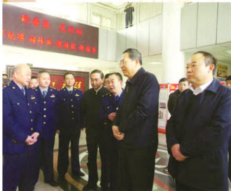
中共安徽省委书记李锦斌视察阜阳市工商局