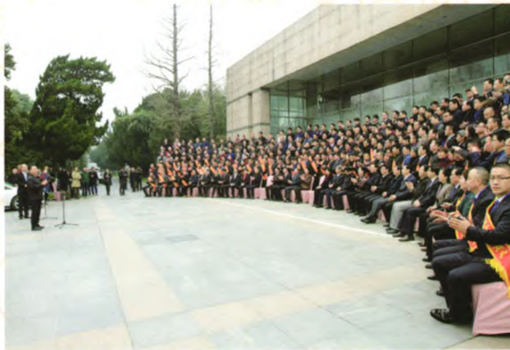
中共安徽省委副书记、省长李国英会见全省“光彩之星”代表