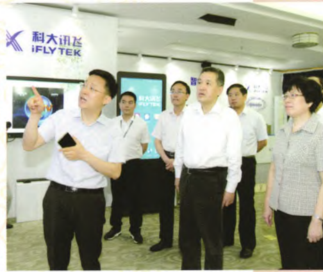
国家工商总局局长张茅在安徽省副省长刘莉、安徽省工商局局长朱斌陪同下视察科大讯飞公司。

改革开放40年,是中国经济蓬勃发展的40年,也是安徽工商行政管理系统恢复建制、创新发展的40年。安徽省工商局积极适应时代发展和社会主义市场经济的需要,逐步建立健全工商行政管理机构,大力培育市场体系,维护经济社会秩序,推动国民经济协调发展,促进国有企业改制搞活,为实现计划经济向社会主义市场经济转变,发挥了重要作用。同时,工商行政管理的监管方式也发生着改变,全省各级工商行政管理机关针对新时期市场经济特点和规律逐步建立起市场监管的长效机制,有效地规范社会主义市场经济秩序,为促进全省经济社会又好又快发展做出了积极贡献。