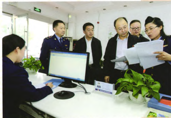
安徽省工商局党组书记、局长朱斌在基层调研市场监管工作。